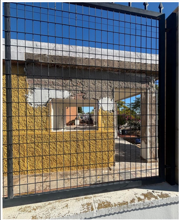
Foto 2. Imagen del porche donde se aprecia el tendedero.