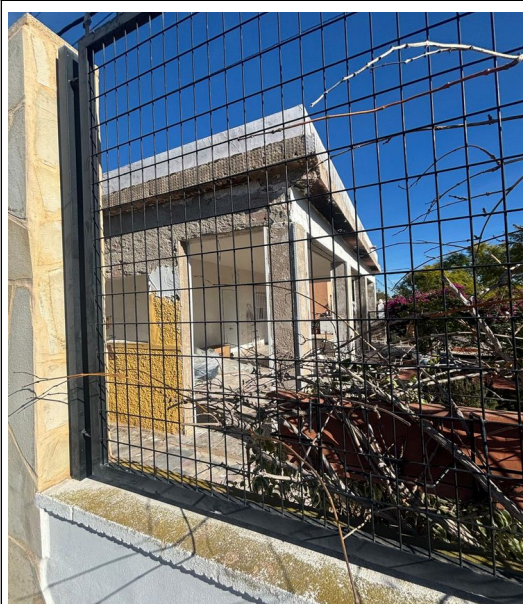
Foto 3. Imagen del porche.