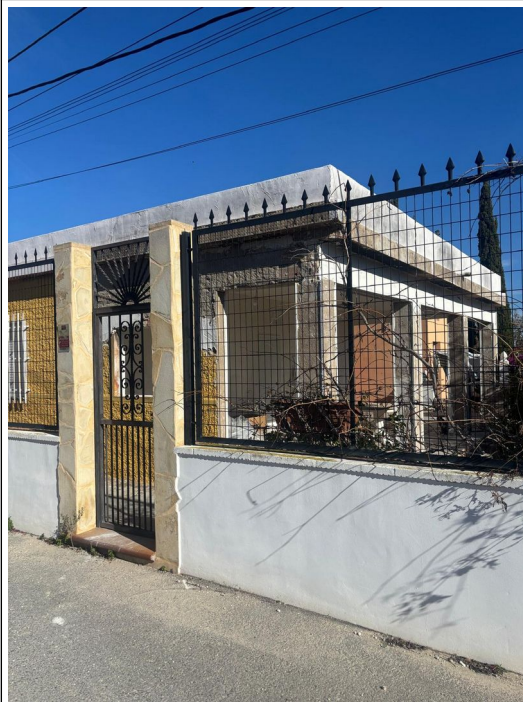
Foto 1. Imagen del porche incendiado.